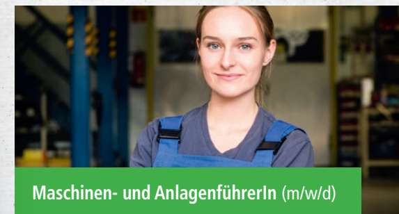
Maschinen- und AnlagenführerIn (m/w/d)