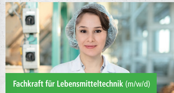
Fachkraft für Lebensmitteltechnik (m/w/d)

Bei Interesse bieten wir Dir gerne ein Praktikum an. Sende uns hierfür gerne Deine vollständigen Bewer- bungsunterlagen per Post oder per E-Mail an personal@sauerteig.de .